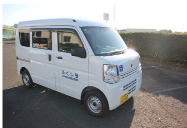
福祉車両の貸し出し