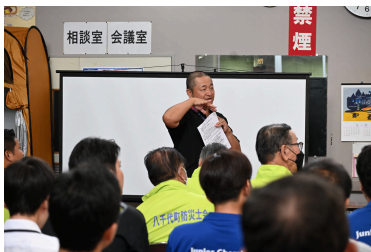
災害ボランティアセンター設置訓練