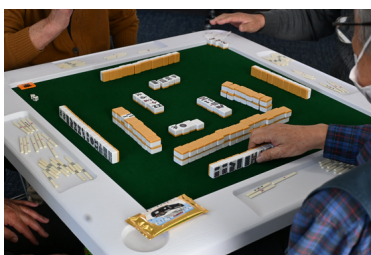
健康マージャン講座