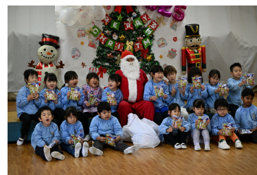
サンタクロース派遣事業