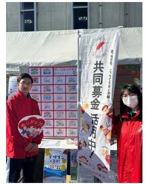
イベント募金の高校生ボランティア