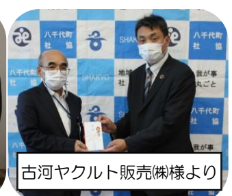
古河ヤクルト販売(株)様より