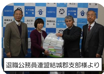
退職公務員連盟結城郡支部様より